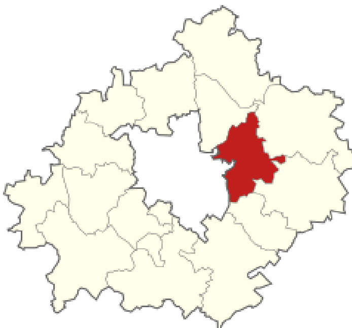
Rys. Położenie gminy Swarzędz na tle powiatu poznańskiego