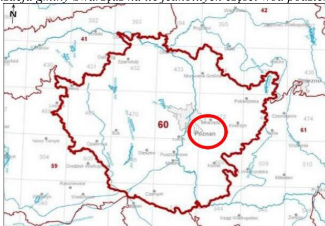
Lokalizacja gminy Swarzędz na tle jednolitych części wód podziemnych