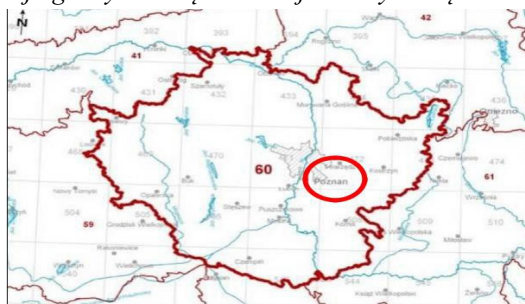
Lokalizacja gminy Swarzędz na tle jednolitych części wód podziemnych