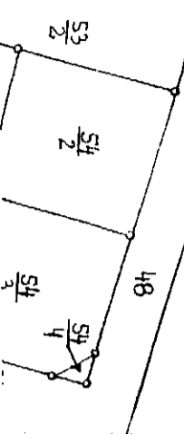
Rys. pob. nr 4 skala 1:1000