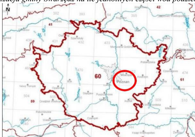
Lokalizacja gminy Swarzędz na tle jednolitych części wód podziemnych