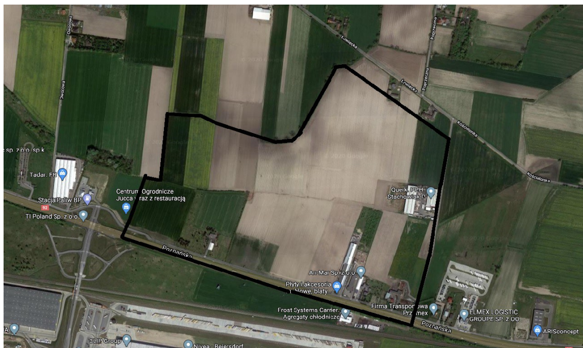
— teren objęty miejscowym planem zagospodarowania przestrzennego

Przedmiotowy teren stanowią drogi, tereny rolne, zabudowa usługowa, produkcyjna oraz budynki mieszkalne jednorodzinne z zabudową gospodarczą. Przez teren opracowania przebiega linia elektroenergetyczna średniego i niskiego napięcia. Obszar planu graniczy z zabudową usługową, przemysłową oraz terenami rolnymi.