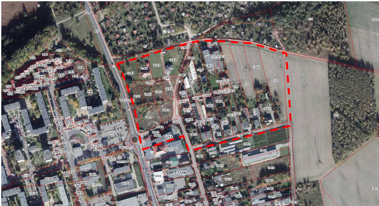
Załącznik nr 1. Lokalizacja obszaru objętego opracowaniem planu na tle ortofotomapy