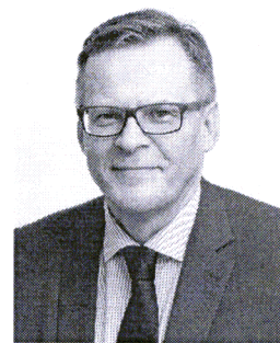
PREZES KASY ROLNICZEGO UBEZPIECZENIA SPOŁECZNEGO